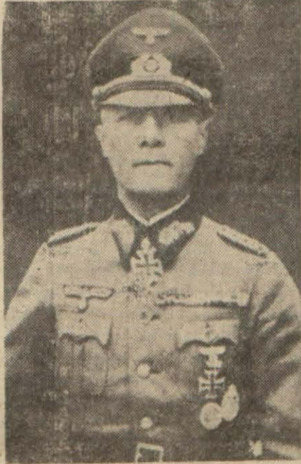
Mihver orduları başkomutanı Mareşal Rommel

Alman ve İtalyan tebliğleri İngilizlerin birçok tank kaybettiklerini bildiriyorlar