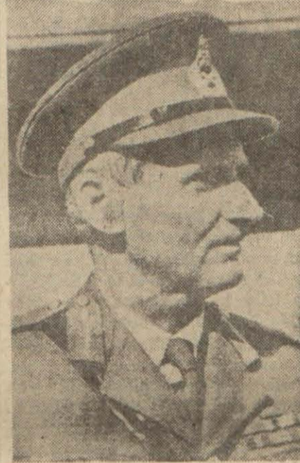
Taarruza geçen İngiliz komutanı General Montgenery

Kahire, 25 (A.A.) — Ortaşark Sekizinci ordunun ileri kolları İngiliz kuvvetleri Pazar müsterek tebliği: sabah gün doğarken düşman ana (Devamı 5 inci sayfada)