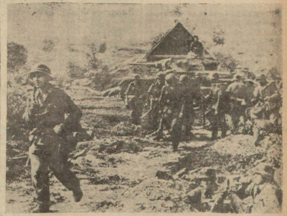
Rusyada ilerleyen bir Alman kolu

Bern 25 (A.A.) — Resmî bildirildiğine göre, Londradaki İsveç elçisi, 24/25 İlkteşrin gecesi İngiliz tayyareleri tarafından «İsveç topraklarının vahim bir tecavüz maruz bırakılmasını» şiddetle protesto etmesi için hükümetinden talimat almıştır.