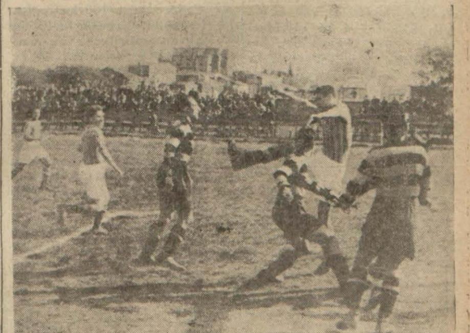
Galatasaray - Beykoz maçından heyecanlı bir sahn

Galatasaray Beykoz 4-1, Beşiktaş I. Spor 6-1 yendi, Fener Vefa ile 3-3 berabere kaldı